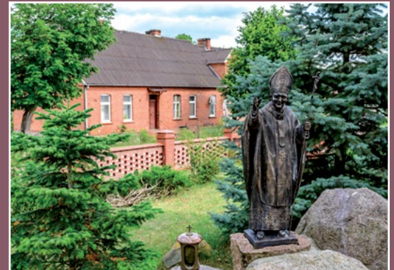
Plebania Pfarrhaus in Piłka