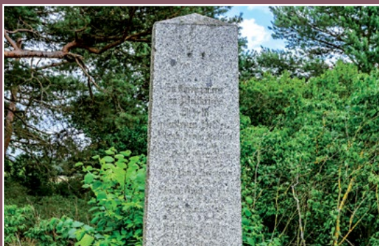
Pomnik poległych w Pełczy Gefallenendenkmal in Pełcza

zeum Okręgowe w Pile i przeniosło ją do Muzeum Kultury Ludowej w Osieku, tylko obora pozostała na miejscu