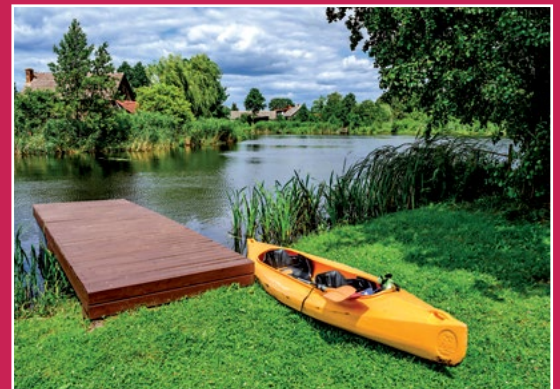
Przystań kajakowa w Kamienniku Anlegestelle in Kamiennik