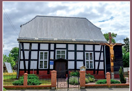
Dawny kościół ewangelicki w Chełście Ehemalige evangelische Kirche in Chełst