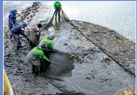
Odtowy ryb na terenie NGR Fischfang auf dem Gebiet der Netzer Fischer Gruppe (NGR)