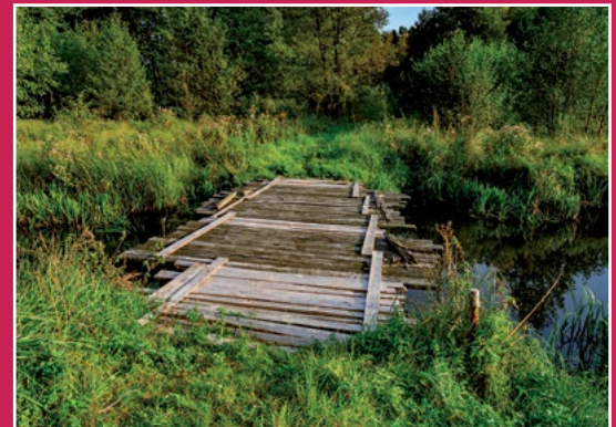
Kładka na szlaku turystycznym w Piłce Steg auf dem Wanderweg in Piłka