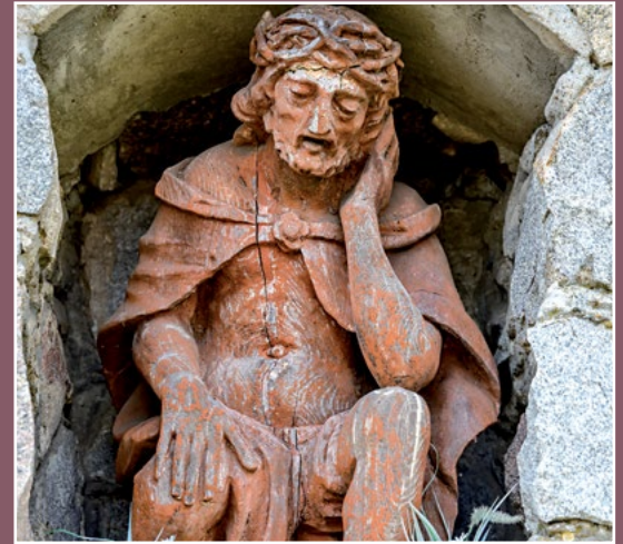
Kapliczka na cmentarzu w Drawsku Kapelle auf dem Friedhof in Drawsko