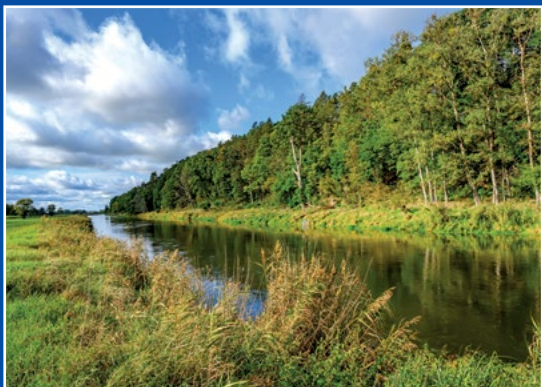
Noteć koło Moczydła Netze bei Moczydla

Noteć, płynąca ze wschodu na zachód stanowi naturalną granicę gminy od północy, wzdłuż meandrującej rzeki zlokalizowane są pola uprawne i pastwiska. Noteć to rzeka o ustroju śnieżno-deszczowym, której maksimum przypada wiosną (przez topnienie śniegów) i latem (wskutek opadów atmosferycznych).