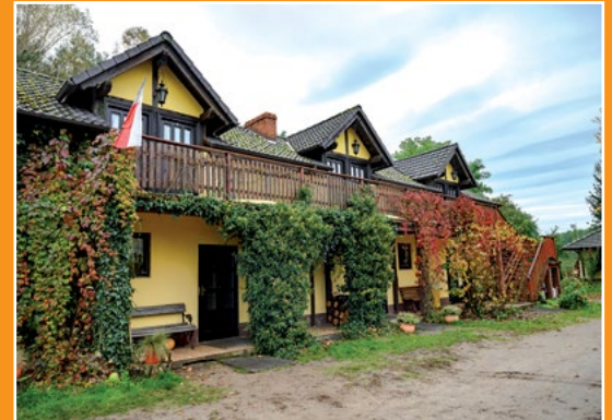
Gospodarstwo agroturystyczne Brokowo Agrartourismusbauernhof Brokowo