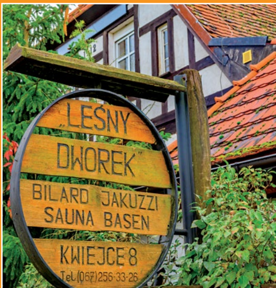
Gospodarstwo agroturystyczne Leśny Dworek Agrartourismusbauernhof Leśny Dworek