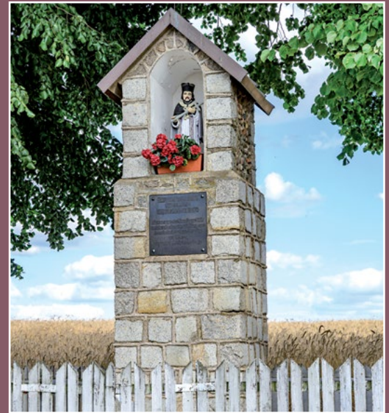
Kapliczka św. Wawrzyńca w Pęcownie Kapelle des heiligen Laurentius in Pęckowo