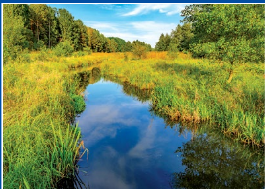
Miała w Piłce Miała – Flüß in Piłka