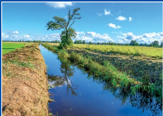
Kanał Chełst Chełst - Kanał