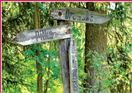
Leśne drogowskazy Wegweiser im Wald