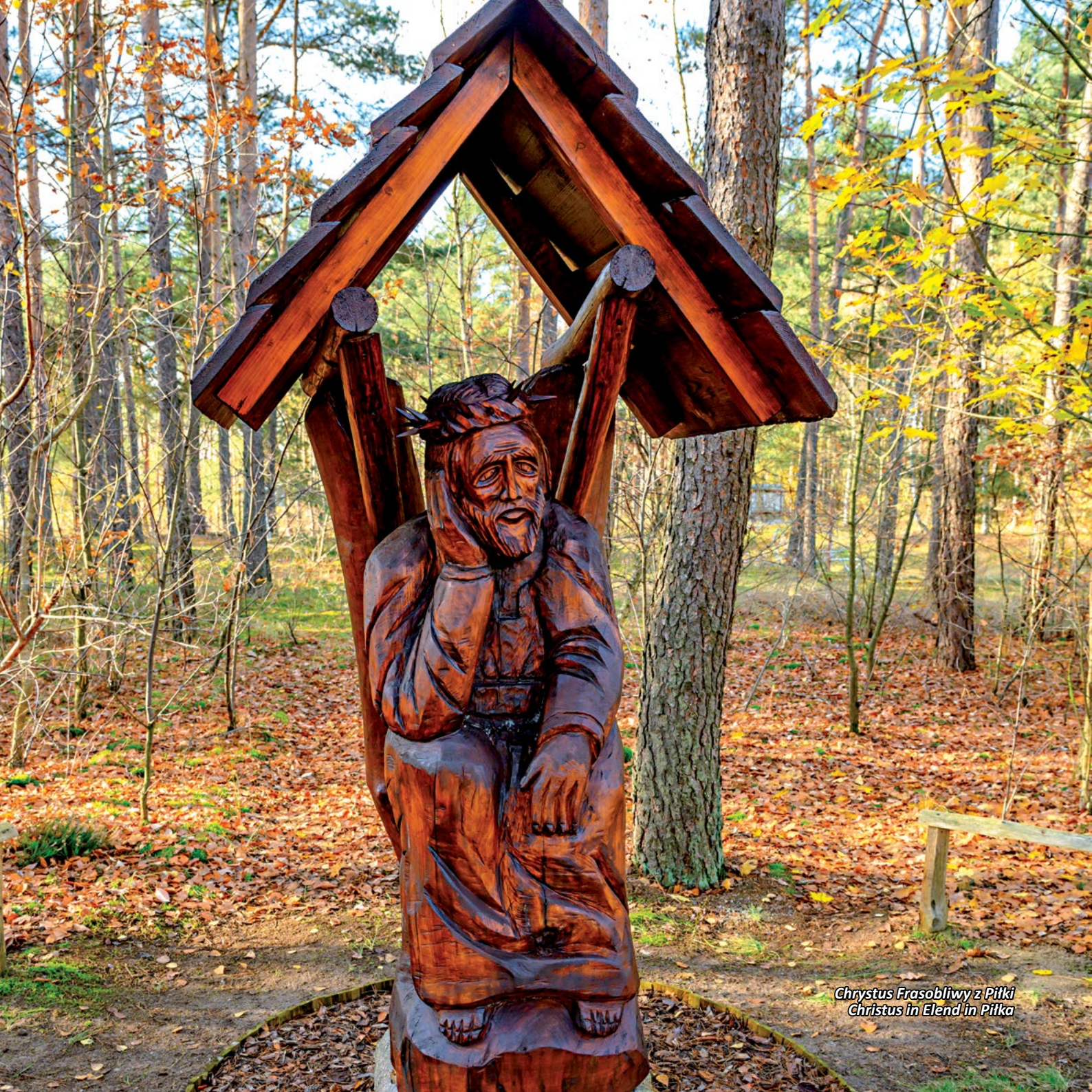
Chrystus Frasobliwy z Pilki Christus in Elend in Pilka