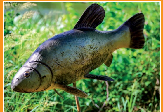
Maryliński Świat Ryb Fische Welt in Marylin