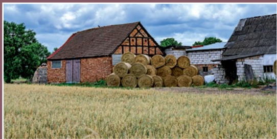
Stara zabudowa w Moczydłach Alte Bebauung in Moczydła