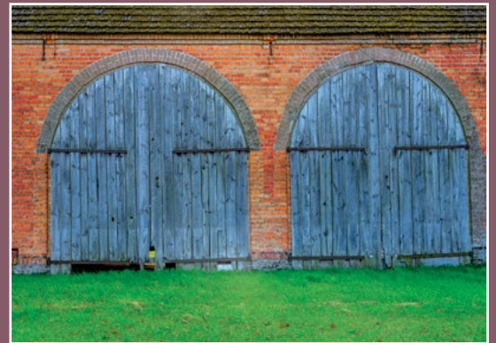
Stodoła w Moczydłach Scheune in Moczydła