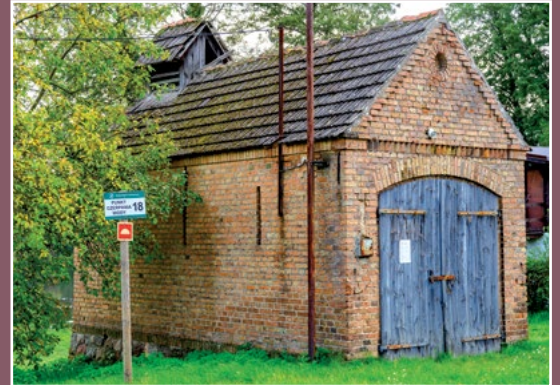
Dawna remiza Kamienniku Alte Feuerwache in Kamiennik