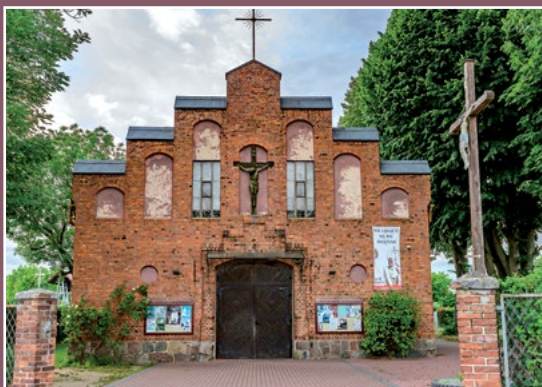
Kościół w Drawsku Kirche in Drawsko