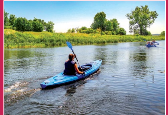
Kajakiem po Noteci Mit dem Kajak auf der Netze