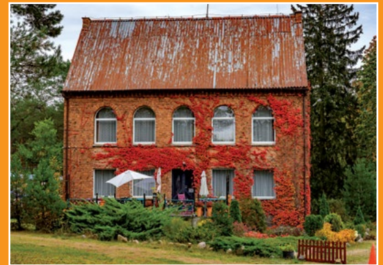
Gospodarstwo agroturystyczne Zieleniec Agrartourismusbauernhof Zieleniec