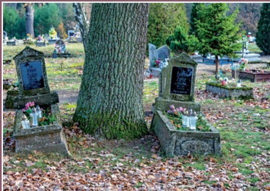
Cmentarz katolicki w Piłce Katholischer Friedhof in Piłka