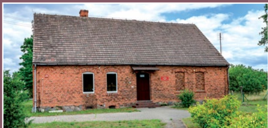
Dawna szkoła w Kawczynie Ehemalige Schule in Kawczyn