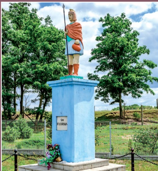
Figura św. Floriana w Kawczynie Figur des heiligen Florian in Kawczyn