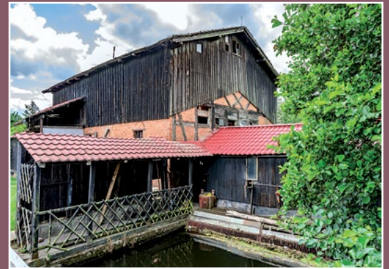
Młyn w Kamienniku Mühle in Kamiennik