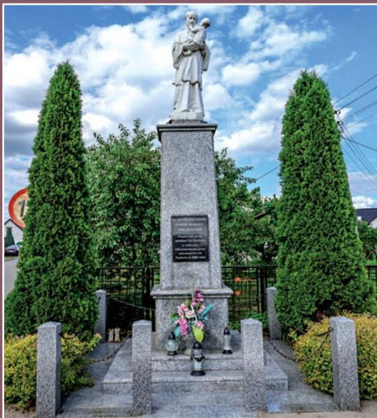
Figura świętego Stanisława Kostki Figur des heiligen Stanislaw Kostka in Pęckowo

W 1595 r. Piotr Czarnkowski sprzedał Chrystianowi margrabiemu brandenburskiemu dobra wieleńskie za 25 000 złotych !