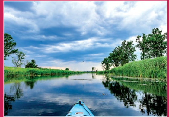
Kajakiem po Noteci Mit dem Kajak auf der Netze

Rybę oprawić. Ostrożnie solić ze względu na sól zwarta w kapuście. Kapustę wypłukać, aby nie była zbyt kwaśna lub słona. Słoninę pokrajana w kostki zeszklić, dodać posiekana cebule, trochę smalcu, paprykę pokrajana w talarki, wsypać szybko paprykę mieloną, zamieszać i natychmiast dodać kapustę, popieprzyć i dusić na małym ogniu ok. godziny. ze smalcu i maki przyrządzić zasmażkę i dodać do niej drobno posiekany koperek. Zaciągnąć tym duszona kapustę. Dodać do kapusty filety rybne i dusić pod przykryciem w piecyku ok. 20 min. Na koniec dodać śmietaną i raz zagotować. Podawać na półmisku, na który najpierw wyklada się kapustę, na nią filety. Polewa się to śmietaną i stopionym smalcem z papryką. Z reszty suma można zrobić galarete, zwykłym sposobem robienia rybnej galarety.