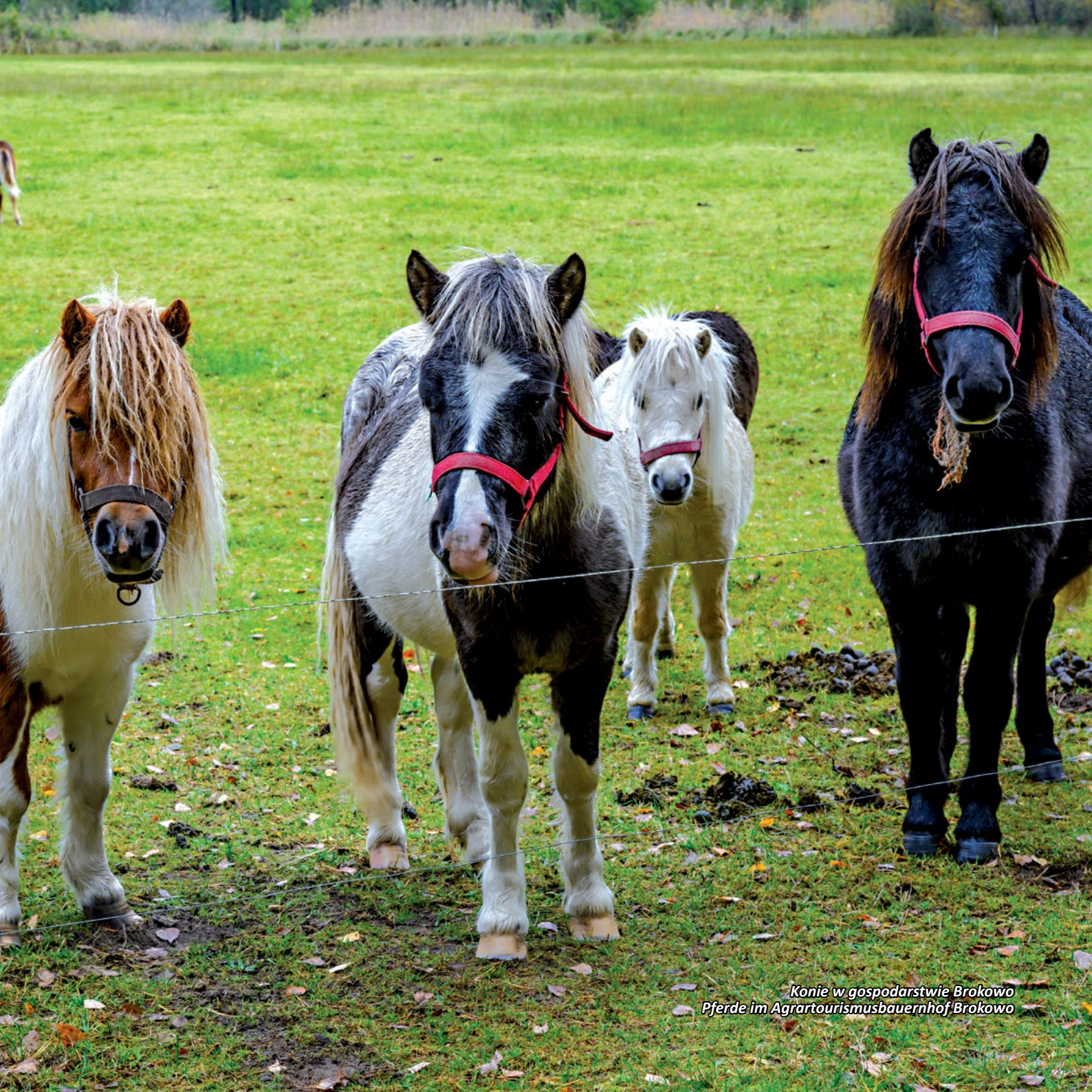
Konie w gospodarstwie Brokowo Pferde im Agrartourismusbauernhof Brokowo