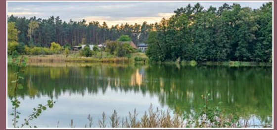
Leśna osada Borzysko Młyn Waldsiedlung Borzysko Młyn

W XV w. na Noteci istniał jaz należący do Drawska służący do połowu ryb. W latach 1564/65 wzmianka o mieszkańcach Drawska, którzy łowią ryby w Noteci i po połowie ze wsią Bielice w Drawie. Do wsi Drawsko należały młyny: Drawski Młyn i Zawada na strudze Hamrzysko. Pola i łąki Drawska graniczyły z Marchią Brandenburską; jedna z łąk używana była przemiennie – w jednym roku kosili ją miesz-