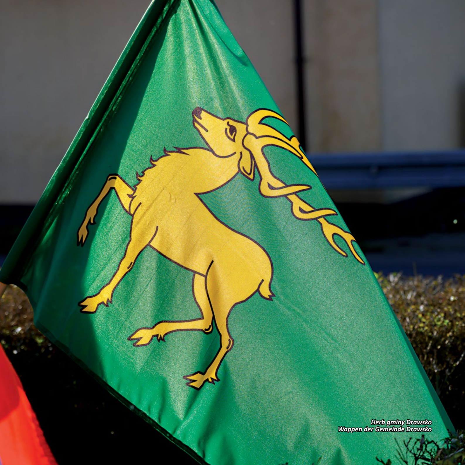
Herb gminy Drawsko Wappen der Gemeinde Drawsko