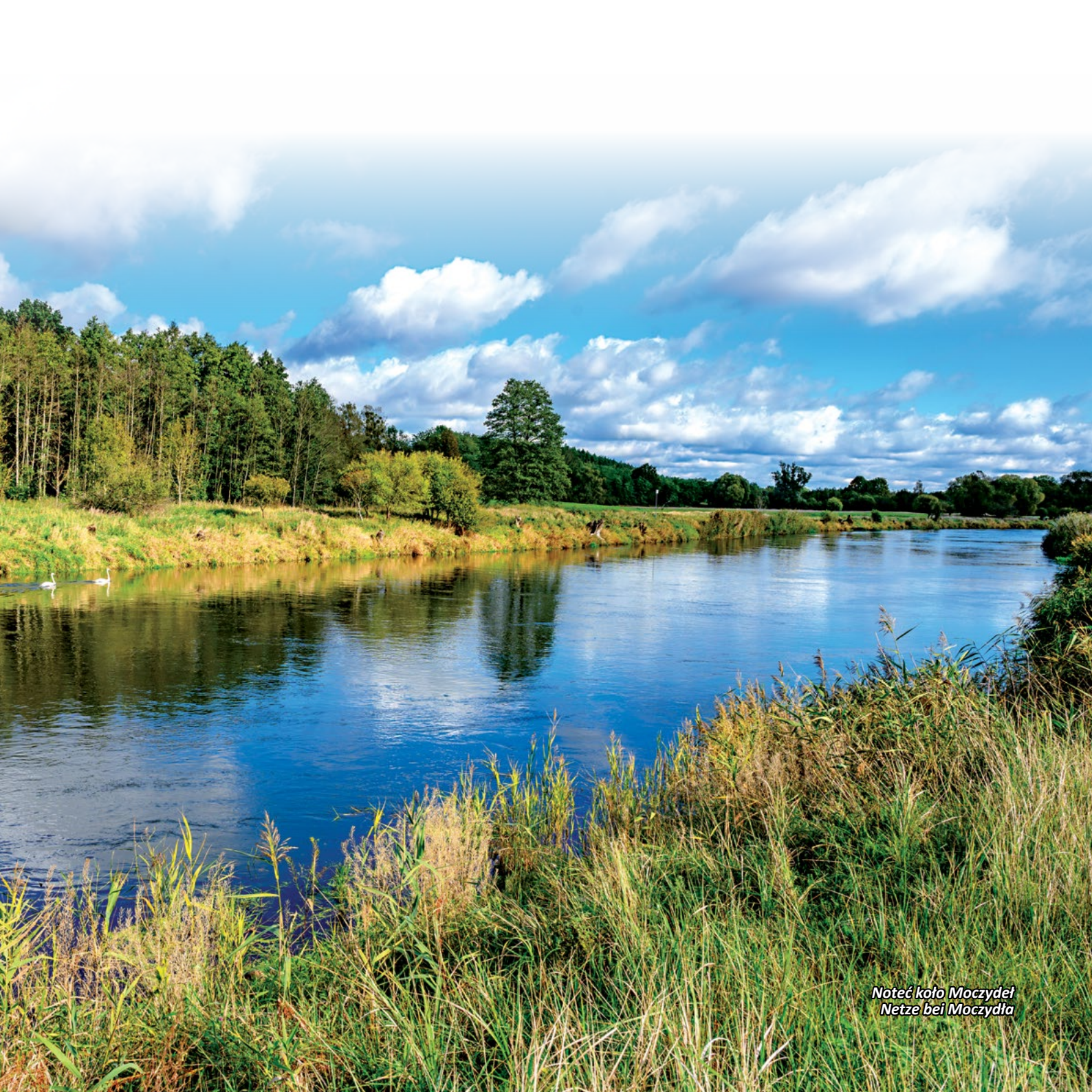
Noteć koło Moczydeł Netze bei Moczydła