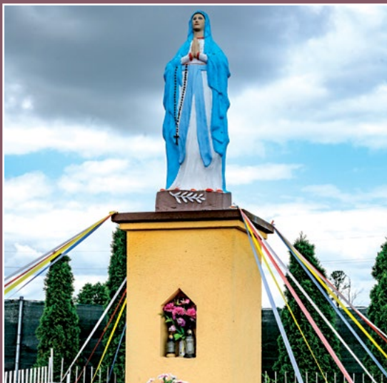
Kapliczka w Moczydłach Kapelle in Moczydła