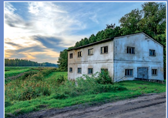
Stawy Zawada Teiche in Zawada