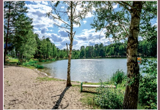
Jezioro Marylin Marylin See