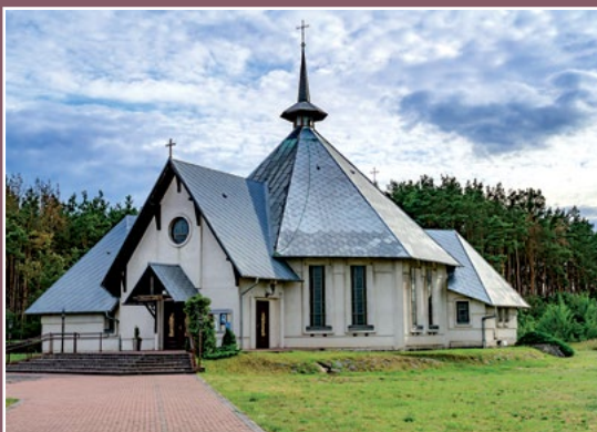
Kościół w Drawskim Młynie Kirche in Drawski Młyn