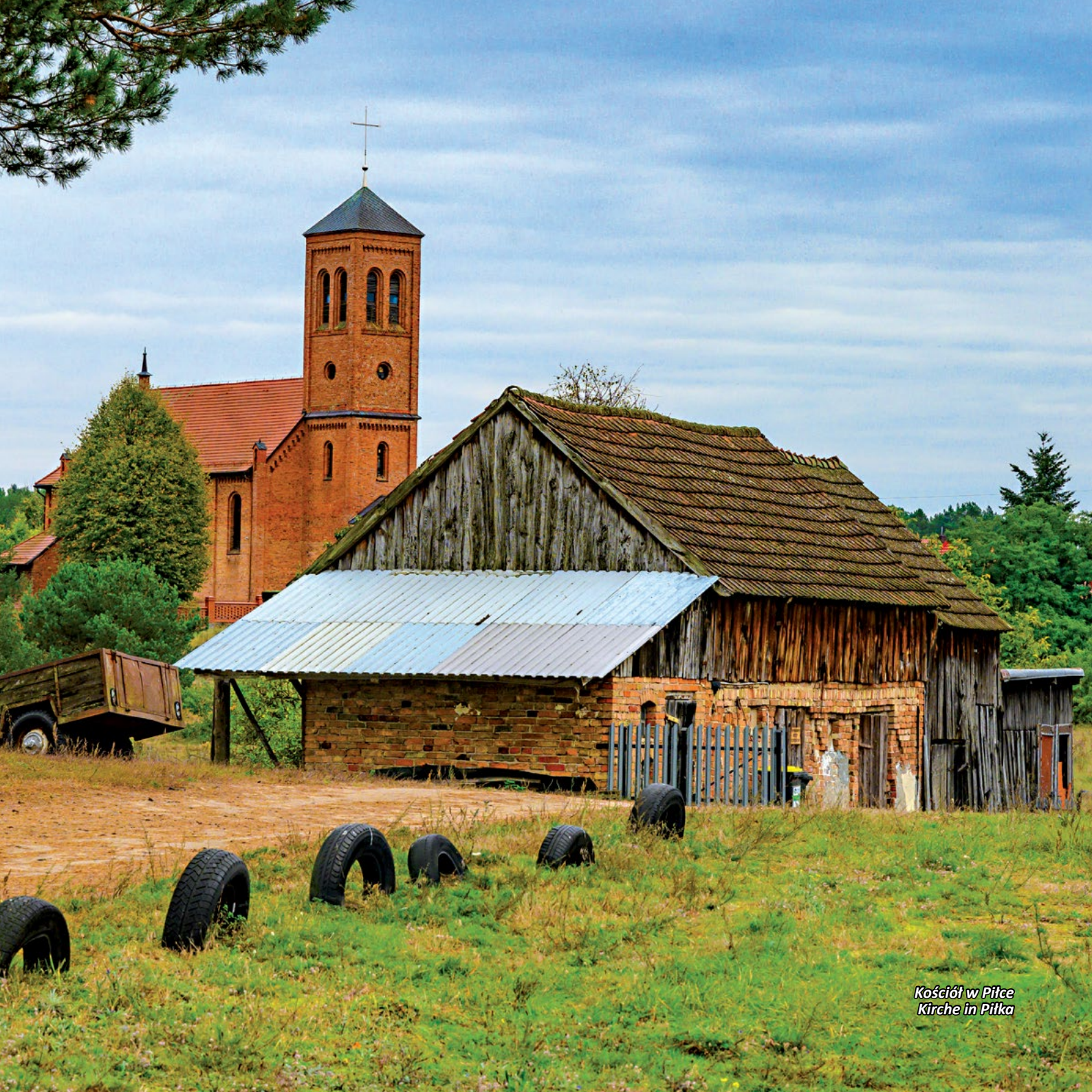
Kościół w Piłce Kirche in Piłka