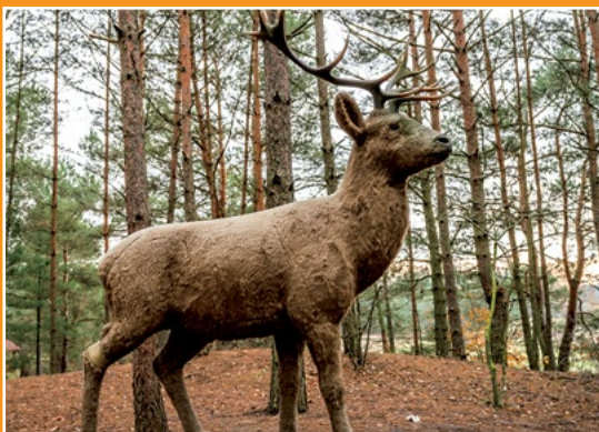
Park Grzybów Leśnych Piłzpark

bliskość lasów Puszczy Noteckiej i jezior, spokój, cisza, ciekawie przygotowane ekspozycje wzdłuż ścieżki parku są atrakcyjnym sposobem na terenowe lekcje biologii dla szkół i przedszkoli, a także zachętą do edukacyjnych wycieczek i spacerów dla rodzin z dziećmi.