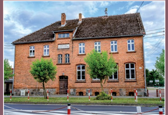
Szkoła w Drawsku Schule in Drawsko