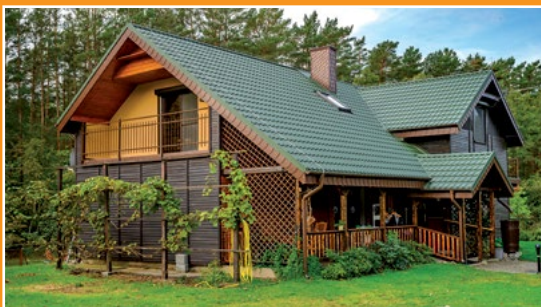
Gospodarstwo agroturystyczne Karpniki Agrartourismusbauernhof Karpniki