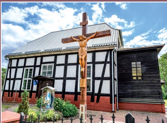
Kościół w Chełście Kirche in Chełst

Szczególnie bujny rozwój osadnictwa i powstawania wsi nastąpił od XV – XVI w. Najstarszą wsią na terenie gminy jest Drawsko wzmiankowane w 1298 roku; kolejne wsie, jak Drawski Młyn, Pęckowo i Chełst powstały w XVI wieku, osadę Piłka z młynem założono na początku XVII wieku, Zieleniec (aktualnie to część wsi Kwiejce Nowe); Kwiejce Nowe oraz prawdopodobnie Kamiennik, Kawczyn i Pełcza pochodzą z XVIII wieku.