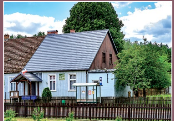
Świątlica wiejska w Kwiejcach Starych Gemeinschaftshaus in Kwiejce Stare