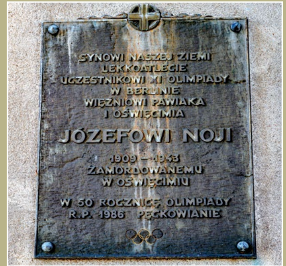
Tablica pamiątkowa Józefa Noji w Pęcckowie Gedenktafel an Józef Noji in Pęcckowo

Leszcza posolić, posypać pieprzem, odstawić na 2 godziny w chłodne miejsce. Folię aluminiową wysmarować grubo masłem, włożyć rybę i zawinąć, wstawić na 20 minut do piekarnika. Wyjąć, ostudzić, zdjąć folię, wyłożyć na żaroodporny półmisek, wstawić na 5 minut do piekarnika. Posypać posiekaną natką pietruszki. Położyć kilka kawałków świeżego masła. Podawać z frytkami, surówką z cykorii lub zielonej sałaty z oliwą.