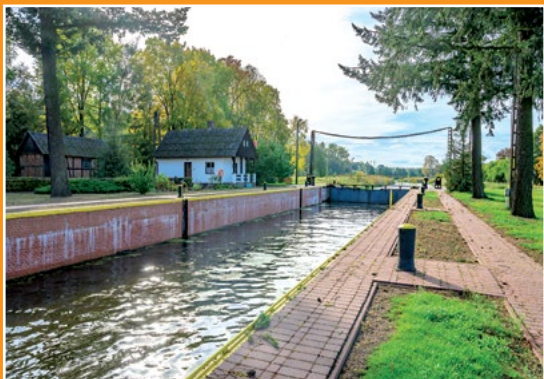
Śluza w Drawskim Młynie Schleuse in Drawski Młyn