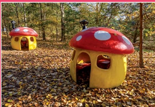
Park Grzybów Leśnych w Piłce Pilzpark in Piłka

roku na festyn zapraszana jest gwiazda imprezy. Podczas festynu promują się zespoły muzyczne i utalentowani wokaliści.