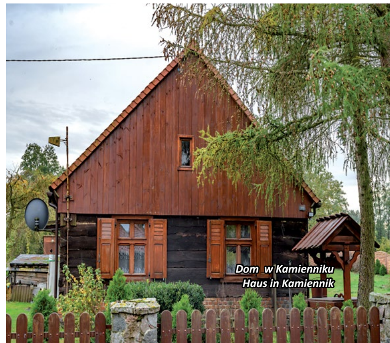
Dom w Kamienniku Haus in Kamiennik

Różny jest układ przestrzenny wsi na terenie gminy: Drawsko, Chełst i Kwiejce mają układ zbliżony do ulicówek, Piłka to wielodrożnica. Do ciekawszych obiektów architektury murowanej z drugiej połowy XIX wieku i początków XX wieku należy budynek, w którym mieści się aktualnie Urząd Gminy Drawsko, pierwotnie będący siedzibą właściciela dóbr ziemskich i tartaku oraz dawne i aktualne budynki szkolne w Drawsku, Drawskim Młynie, Chełście, Kamienniku, Piłce, Pęcownie oraz dawny kościół ewangelicki wraz z pastorówką w Piłce.