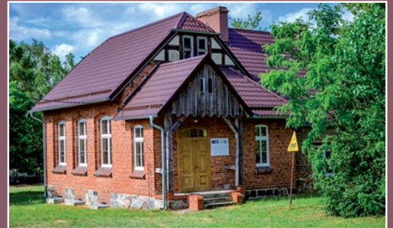
Dawna szkoła w Marylinie Ehemalige Schule in Marylin