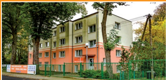
Dom Sportowca w Kwiejcach Starych Haus des Sportlers in Kwiejce Stare