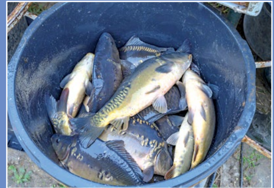
Odtowy ryb na terenie NGR Fischfang auf dem Gebiet der Netzer Fischer Gruppe (NGR)

NGR wdraża LSR w ramach PO „Rybnactwo i Morze” na obszarze 7 gmin członkowskich, tj.: Drawsko, Krzyż Wlkp., Szydłowo, Trzcianka, Wieleń, Chodzież i Czarnków. Teren Gmin wchodzący w skład NGR to obszar, którego największym atutem turystycznym jest przyroda: lasy zajmujące połowę powierzchni, liczne jeziora i gęsta sieć rzek. Sieć szlaków do uprawiania różnego rodzaju wędrówek (pieszych, rowerowych, kajakowych, konnych) uzupełniana jest o elementy infrastruktury turystycznej, przybywa też miejsc noclegowych i placówek gastronomicznych. Liczne jeziora na tym terenie przyciągają wędkarzy, a rzeki o przebiegu górskim (Piława, Dobrzyca, Bukówka) dają też możliwość łowienia ryb łososiowatych. Tutejsze lasy słyną z bogactwa runa leśnego. Kajakarze korzystają z popularnych szlaków Gwdy oraz jej dopływów: Dobrzyca, Piława i Rurzyca, ale na wytrawnych wodniaków czekają też inne, trudniejsze rzeki: Bukówka, Krępicza, Łomnica, Człopica.