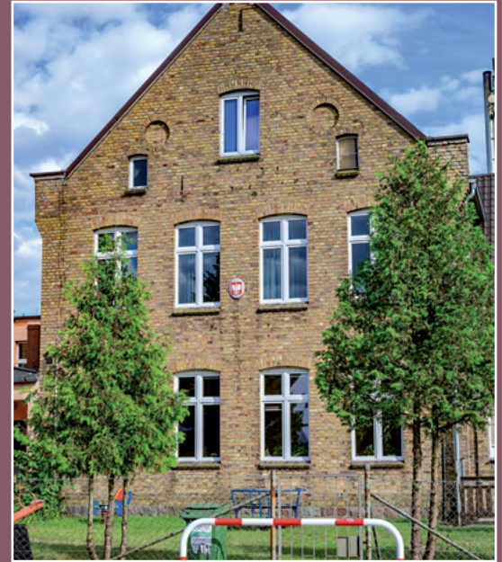
Szkola w Pęcownie Schule in Pęckowo