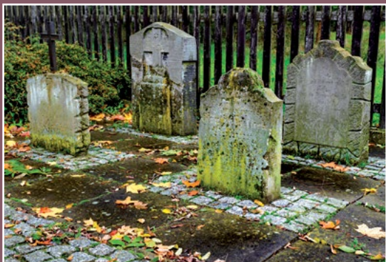
Cmentarz ewangelicki w Kwiejcach Starych Der ehemalige evangelische Friedhof in Kwiejce Stare