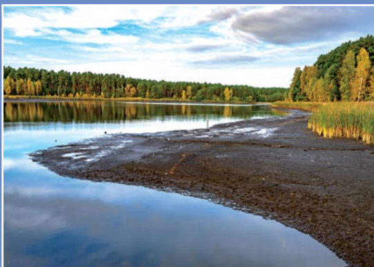
Stawy gospodarstwa Kwiejce - Karpniki Teiche des Fischereibetriebes Kwiejce - Karpniki