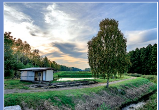
Stawy Zawada Teiche in Zawada