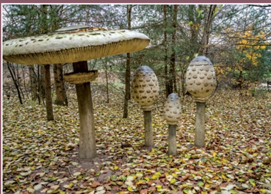
Park grzybów leśnych w Piłce Pilzpark in Piłka