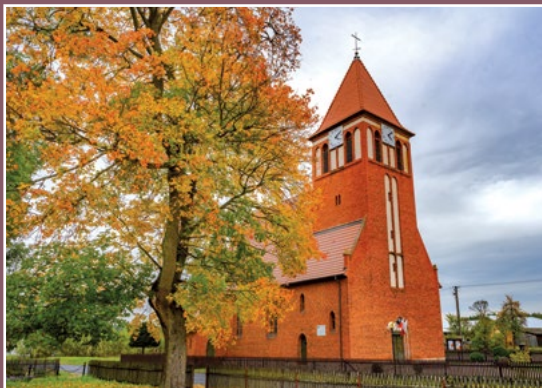
Kościół w Kwiejcach Starych Kirche in Kwiejce Stare