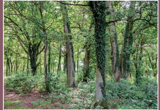
Dawny cmentarz ewangelicki w Kawczynie Der ehemalige evangelische Friedhof in Kawczyn

Początkowo była to osada założona w XVI w. nad Jeziorem Kwiejce. Pierwsza wzmianka o tej osadzie pojawia się w 1592 r. Jezioro Kwiejce znane było już od 1424 r. (pod nazwą Queske ) w 1527 r. Qieczcze, w 1564 r. Kwiejcza. Koło jeziora biegła granica z Nową Marchią. Jezioro o dwóch toniach niewodowych należało do wsi Pęckowo.