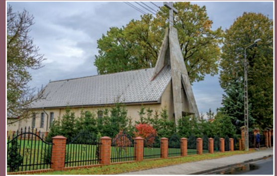
Kościół w Pęcownie Kirche in Pęckowo

W dokumentach w 1565 r. pojawia się wzmianka o pile (tartaku) na rzece Miała należącej do wsi Pęckowo. Tarcie (przetarte drzewa) spuszczano Notecią do Szczecina lub wożono do królewskiej wsi Rataje koło Chodzieży (właścicielem dóbr wieleńskich i Rataj był wówczas Stanisław Górka). Piła mogła przetrzeć tyle tarcic, że starczyło ich na dwie tratwy; na jedną tratwę ładowano 24 kopy tarcic a w Szczecinie 1 kopę sprzedawano za 7 lub 8 złotych. W pobliżu tartaku osiedleni byli zagrodnicy, którzy pilnowali pobliskich stawów.