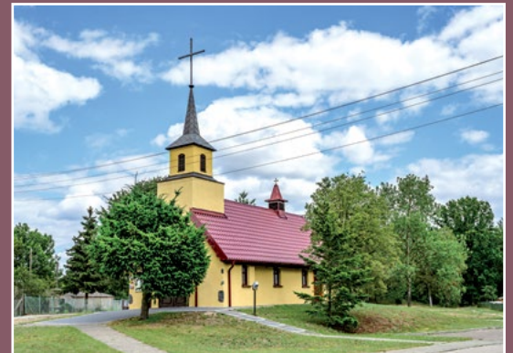
Kościół w Kamienniku Kirche in Kamiennik