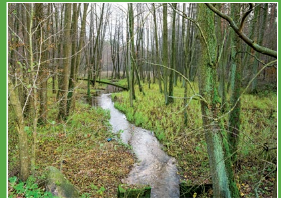
Miały w górnym biegu Oberfluss des Miala - Fliesses