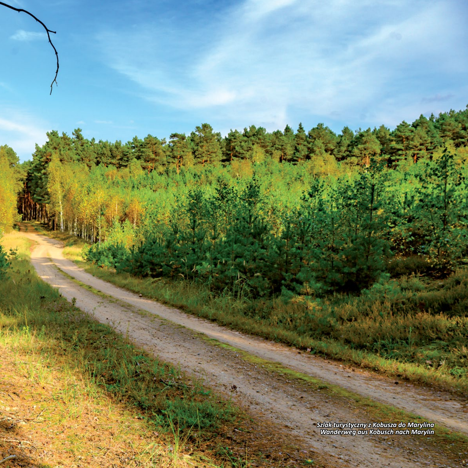
Szlak turystyczny z Kobusza do Marylina Wanderweg aus Kobusch nach Marylin