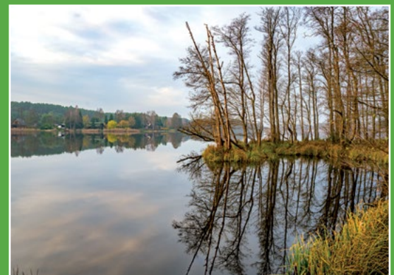
Jezioro Białe Biala - See