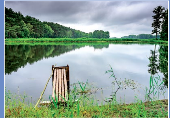
Stawy Zawada Teiche in Zawada

Rybę oczyścić, posolić, pokroić na porcje, obtoczyć w mące i obsmażyć ładnie rumieniąc. Przygotować sos: drobno posiekaną cebulę udusić w maśle razem z pieczarkami pokrojonymi w paseczki. Gdy lekko zrumienią się, posypać mąką, rozprowadzić wywarem i zagotować mieszając. Następnie przelać sos do większego płaskiego rondla, doprawić do smaku solą, wlać wino, włożyć rybę oraz obrane i pokrojone na ćwiartki ziemniaki. Przykryć rondel i dusić na średnim ogniu przez 17-20 min.