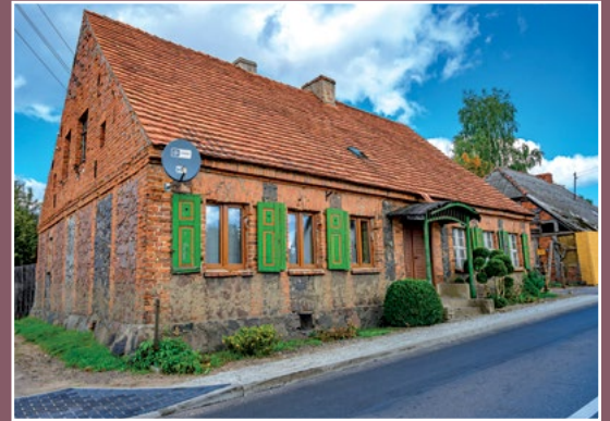
Stary dom w Chełście Altes Haus in Chełst