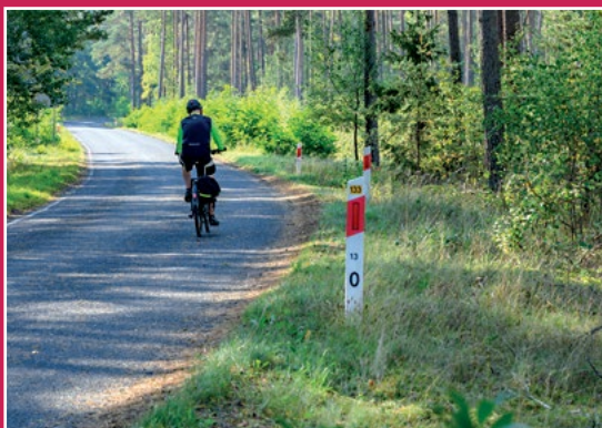
Na szlaku rowerowym Auf dem Radweg