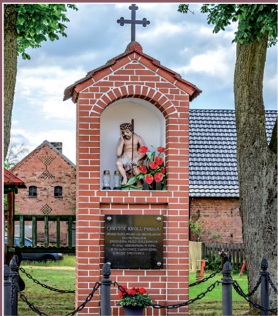
Chrystus Frasobliwy z Pęckowa Christus in Elend aus Pęckowo