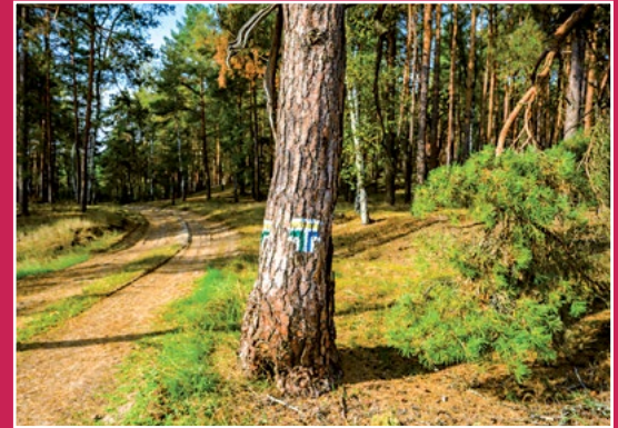
Skrzyżowanie szlaków turystycznych w Kobuszu Knotenpunkt der Wanderwege in Kobusz

Odcinek Piłka – Marylin ma 4,5 km długości. Jest ciekawy ze względu na przebieg szlaku wzdłuż Miały, po drodze przejdziemy po spróchniałym mostku na drugą stronę rzeki, minimy samotne gospodarstwo po lewej stronie a następnie wysokim brzegiem rzeki będziemy podążać do Marylina. Przed Marylinem z wysokiej skarpy wypływają malownicze źródła dopływów Miały.