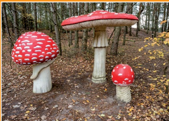
Park Grzybów Leśnych Piłzpark