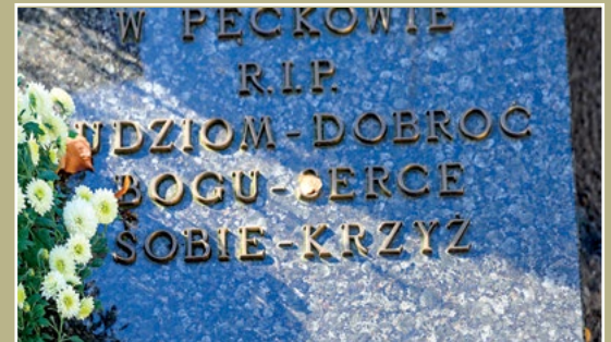
Nagrobek proboszcza z Pęcckowa Grabstein des Pfarrers aus Pęcckowo