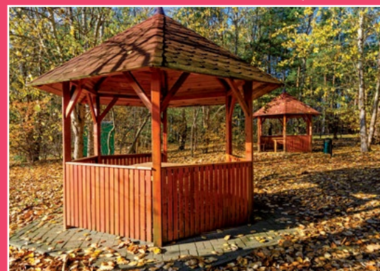
Park Grzybów Leśnych w Piłce Pilzpark in Piłka