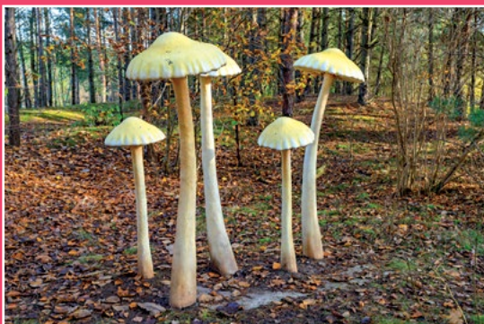
Park Grzybów Leśnych w Piłce Pilzpark in Piłka