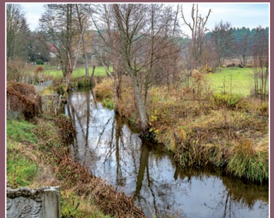
Miała w Marylinie Miale - Fliess in Marylin