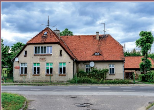
Szkoła w Drawskim Młynie Schule in Drawski Młyn