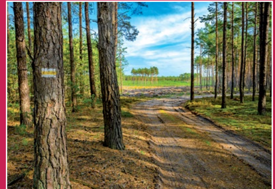
Żółty szlak turystyczny przez Puszcze Notecką Gelber Wanderweg in Netzer Urwald