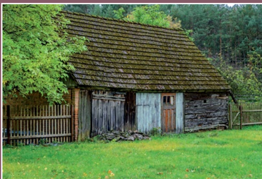
Stare budynki gospodarcze w Kwiejcach Starych Alte Wirtschaftsgebäuden in Kwiejce Stare