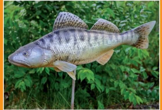
Maryliński Świat Ryb Fische Welt in Marylin

Turystyczna atrakcja znajdująca się nad jeziorem Moczydło w Marylinie, przy drodze wojewódzkiej nr 135 biegnącej przez Puszcze Notecką. Teren jest ogólnodostępny, całoroczny. Atrakcyjność krajobrazu,