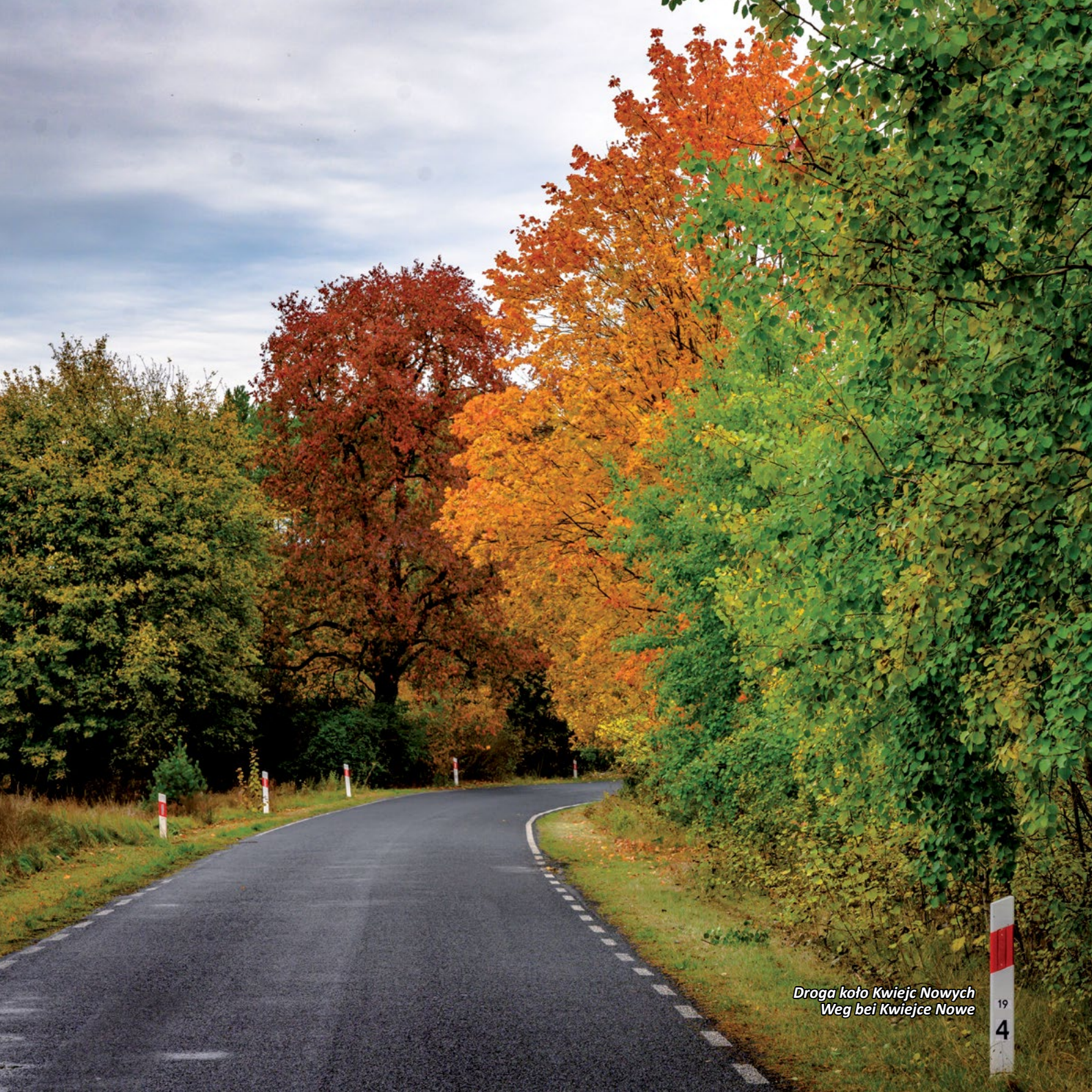
Droga koło Kwiejc Nowych Weg bei Kwiejce Nowe