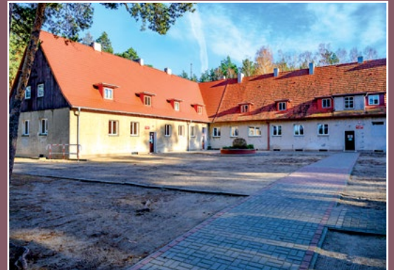
Dawna strażnica graniczna w Chełście Ehemaliges Haus der Grenzwächter in Chełst