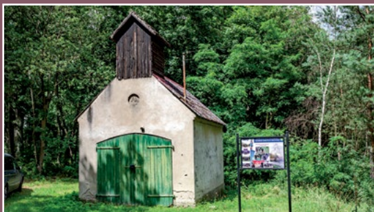
Dawna remiza w Kawczynie Ehemalige Feuerwache in Kawczyn