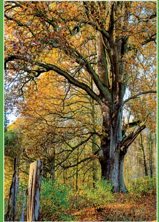
Pomnikowy dąb „Patriarcha” Majestätische Eiche „Patriarcha“