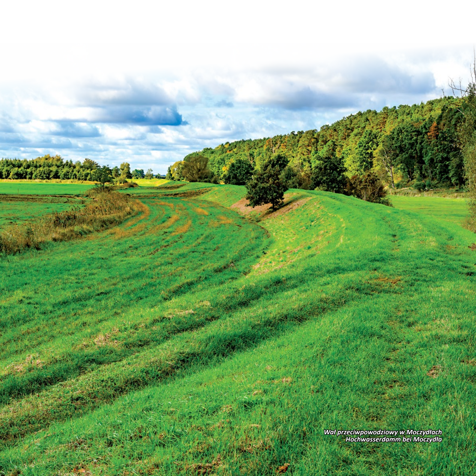
Wał przeciwpowodziowy w Moczydłach Hochwasserdamm bei Moczydła