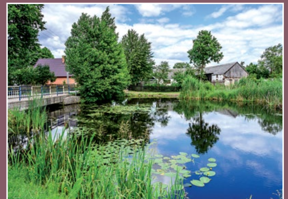
Staw młyński w Kamienniku Mühlenteich in Kamiennik