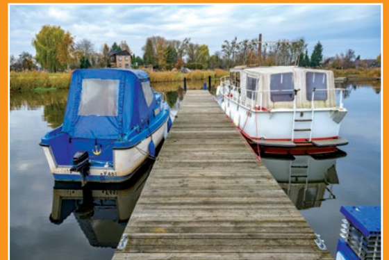
Przystań Yndzel w Drawsku Anlegestelle „Yndzel” in Drawsko