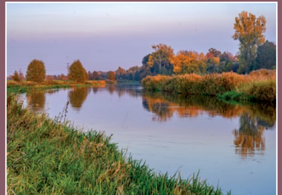
Noteć koło Drawska Netze bei Drawsko