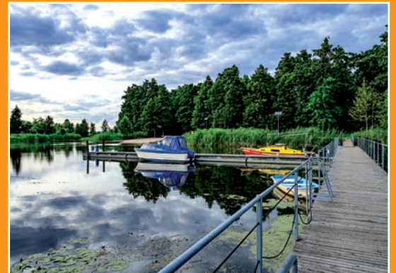
Przystań Yndzel w Drawsku Anlegestelle „Yndzel” in Drawsko