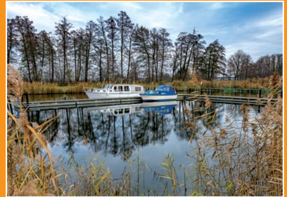
Przystań Yndzel w Drawsku Anlegestelle „Yndzel” in Drawsko

Droga wodna Wisła - Odra projektowana była od połowy XVI wieku. Regulacja Noteci i przystosowanie jej do spławu polskich produktów rolniczych do Szczecina było dyskutowane z Brandenburgią. Po pierwszym rozbiórce polski król pruski Fryderyk II podjął pomysł budowy kanału Brda - Noteć. Miał on łączyć Berlin i Królewiec, był łatwą drogą zaopatrzenia armii pruskiej oraz konkurował z polskim wówczas Gdańskiem. Pierwszy odcinek drogi wodnej o długości 26 km wybudowano w latach 1772 -1774. Ze względu na to, że pierwsza droga wodna była mało sprawna, na przełomie XVIII i XIX wieku przebudowano część śluz na murowane z cegły. Następne ważne przebudowy przeprowadzono w latach 1840-52. Dolną Noteci kanalizowano w latach 1873-82, początkowo realizacja ta była wykonana wadliwie więc od 1891 roku rozpoczęto jej korektę. Wyprostowano wtedy bieg rzeki i wybudowano część śluz w kamieniu i cegle, między innymi śluzę w Drawsku. Kolejne usprawnienia drogi wodnej przeprowadzono na początku XX wieku, wykonano wtedy jazy na odcinku Lipica - Krzyż.