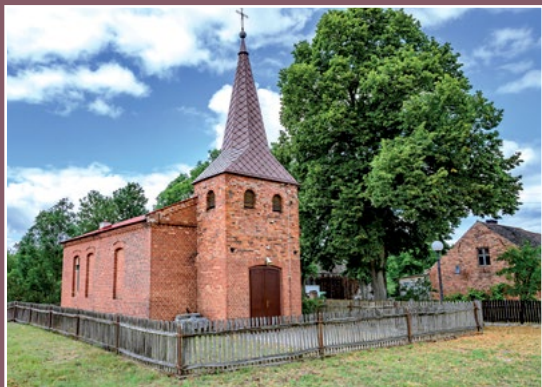
Dawny kościół katolicki w Chełście Alte katholische Kirche in Chełst