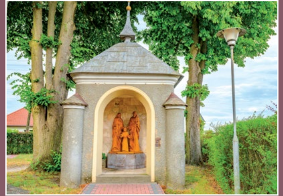
Kaplica w Drawsku Kapelle in Drawsko