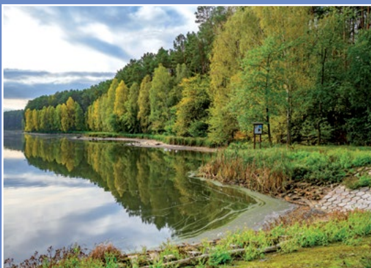
Stawy gospodarstwa Kwiejce - Karpniki Teiche des Fischereibetriebes Kwiejce - Karpniki

Na terenie NGR łącznie funkcjonuje około 50 podmiotów rybackich, w tym 43 to hodowcy stawowi, a 7 to użytkownicy jezior. Całkowita wartość produkcji to ponad 11,5 mln PLN.