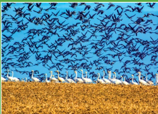
Jesienne wędrówki ptaków Herbstliche Migration der Vögel

szy w Polsce obszar wydm śródlądowych, o przeważającej wysokości 20-30 m, a maksymalnie sięgającej 98 m n. p. m. Wydmy porasta w 92% las sosnowy. Pozostałości drzewostanów naturalnych są objęte ochroną w rezerwach przyrody (rezerwat Cegliniac) Na jego obszarze znajduje się ponad 50 jezior, pochodzenia wytopiskowego, z grubą warstwą mułu i zakwitami glonów. W zagłębieniach terenu lub na brzegach jezior utrzymują się torfowiska.