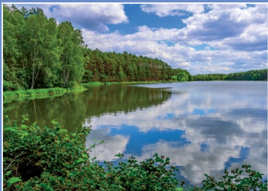
Stawy gospodarstwa Kwiejce - Karpniki Teiche des Fischereibetriebes Kwiejce - Karpniki