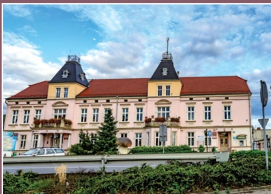
Dawny pałac w Drawsku – obecnie Urząd Gminy Alter Palast in Drawsko – heute Gemeindeamt

kańcy Drawska, w kolejnym poddani margrabiego brandenburskiego z Drezdenka. Do wsi Drawsko należały jeziora i stawy na południe od Noteci: Rakowiec, Rakówko, Brzuchacz, Simek, Kamieniec, Chelst (przy tym stawie biegła granica z Marchią). Na północ od Noteci należały do wsi m.in. jeziora Nieradz, Piaseczno, Głęboczek, Pniewo.