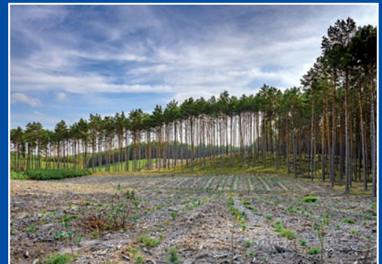
W Puszczy Noteckiej Im Netzer Urwald