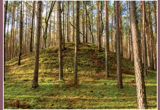
Kurhan koło Moczydeł Grabhügel bei Moczydła

W VIII w. nastąpił rozwój osadnictwa wczesnośredniowiecznego. Rozwój osadnictwa grodowego wpłynął na przemiany osadnictwa otwartego. Było to podstawą do kształtowania się wczesnoplemiennych, a później wczesnopiastowskich struktur osadniczych. W tym czasie kształtuje się obecny układ miejscowości, stanowiska średniowieczne i nowożytne występujące w pobliżu obecnych miejscowości wyznaczają tym samym ich metrykę.