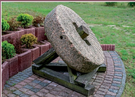
Kamień młyński w Drawskim Młynie Mühlenstein in Drawski Młyn