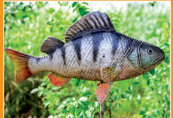
Maryliński Świat Ryb Fische Welt in Marylin