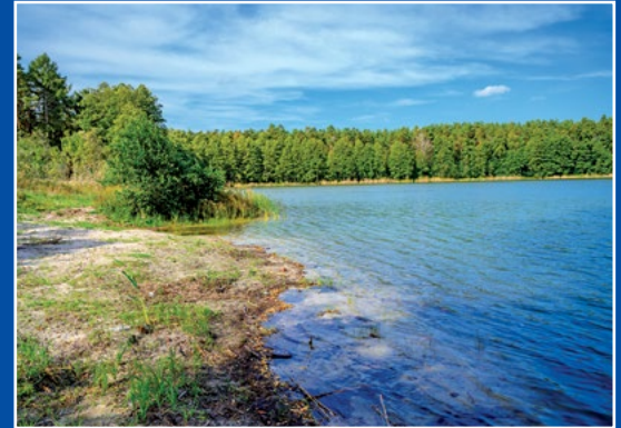
Jezioro Długie w Borowym Młynie Lange See in Borowy Młyn

Przez gminę Drawsko płyną cztery rzeki: Noteć, Miała, Rudawa oraz Człapia.