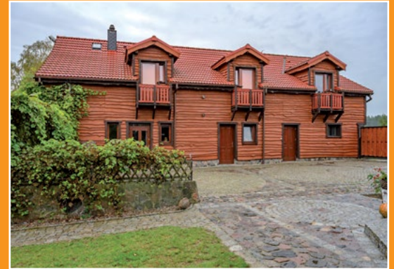
Rancho Bonanza Rancho Bonanza

Gospodarstwo posiada pokoje 2, 3 i 4 - osobowe oraz apartamenty. Do dyspozycji gości: jacuzzi, sauna fińska, sala bilardowa, basen, siłownia, kort tenisowy, kręgielnia, zadaszone miejsce przeznaczone do grillowania na świeżym powietrzu z drewnianymi, solidnymi siedziskami, salon, suszarnię dla grzybów oraz wędzarnię dla ryb. Do dyspozycji jest również łódka na jeziorze oraz rowery górskie. Na życzenie gości organizowane są spływy kajakowe i przejażdżka bryczką.