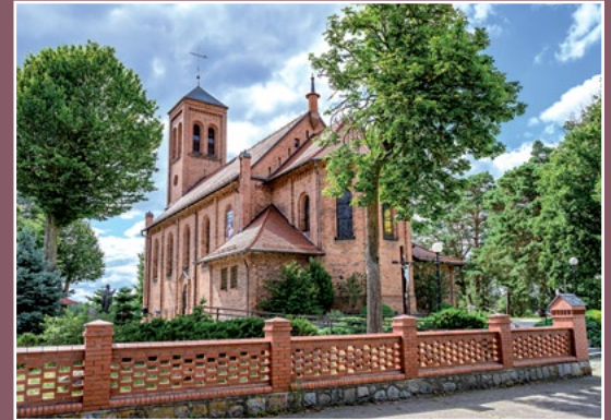
Kościół w Piłce Kirche in Piłka

Oczyszczonego i sprawnego karpia umyć, pokroić na dzwonka, posolić, odstawić na pół godziny w chłodne miejsce. Śliwki opłukać, wydrylować i zmiksować z winem i przyprawami. Rybę obtoczyć w mące, zrumienić na oliwie z obu stron. Ułożyć w żaroodpornym naczyniu, połąć sosem i zapiec. Podawać z ziemniakami z wody i surówką z cykorii.