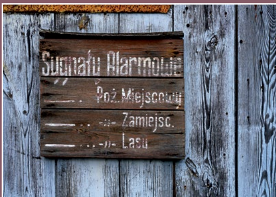
Remiza w Kwiejcach Nowych Ehemalige Feuerwache in Kwiejce Nowe