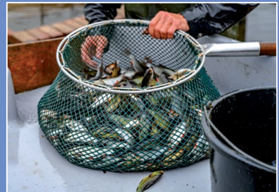
Odtowy ryb na terenie NGR Fischfang auf dem Gebiet der Netzer Fischer Gruppe (NGR)