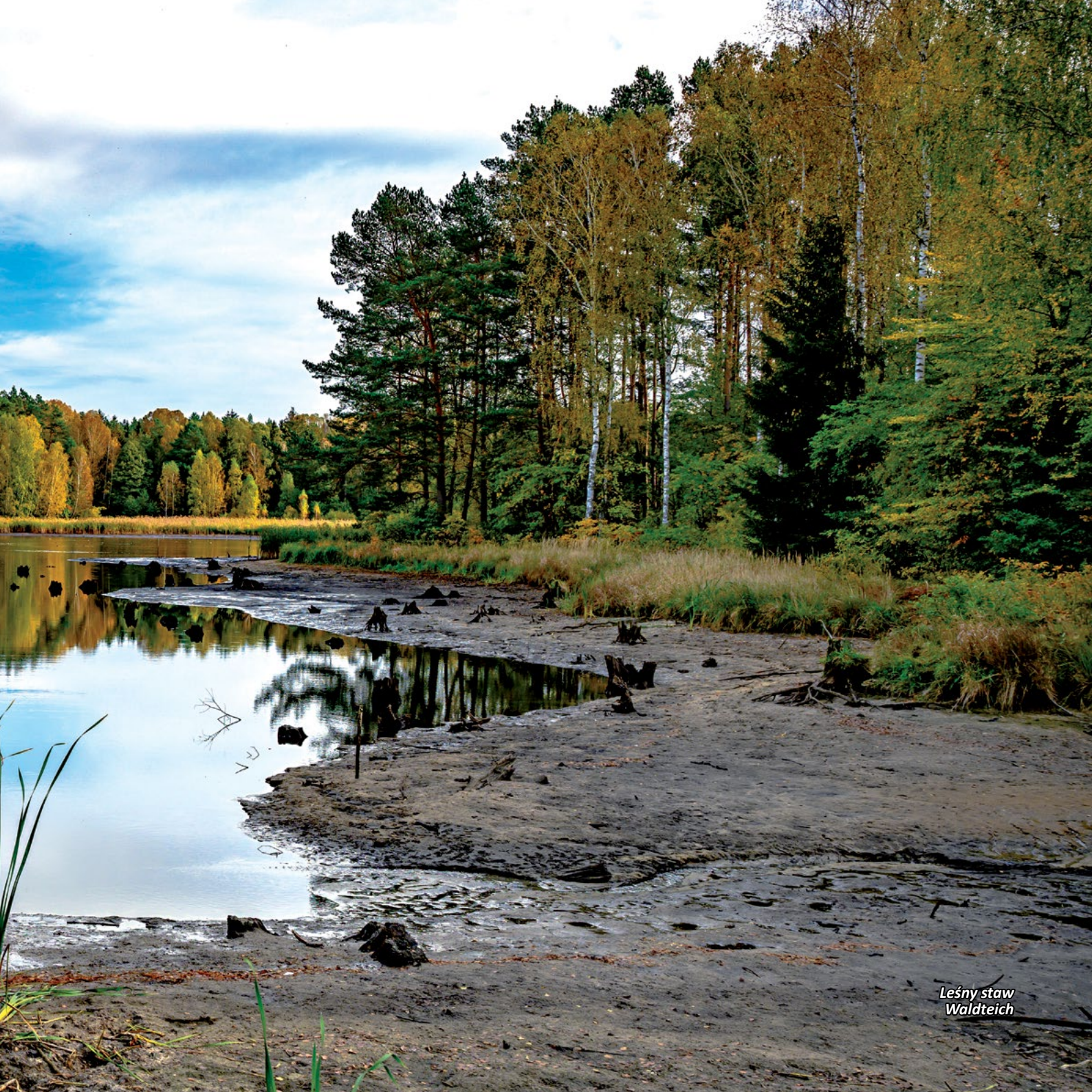
Leśny staw Waldteich