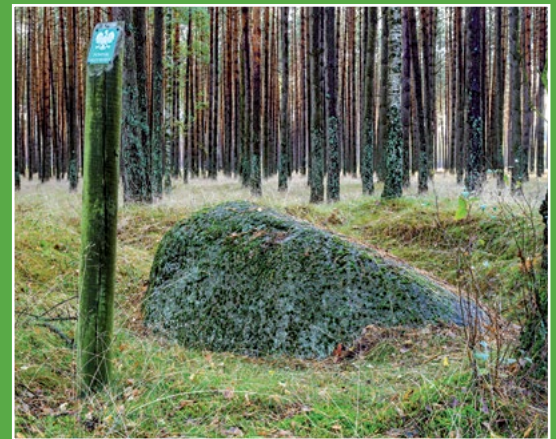
Pomnik przyrody głaz narzutowy koło Drawsko Naturdenkmal – Findling bei Drawsko