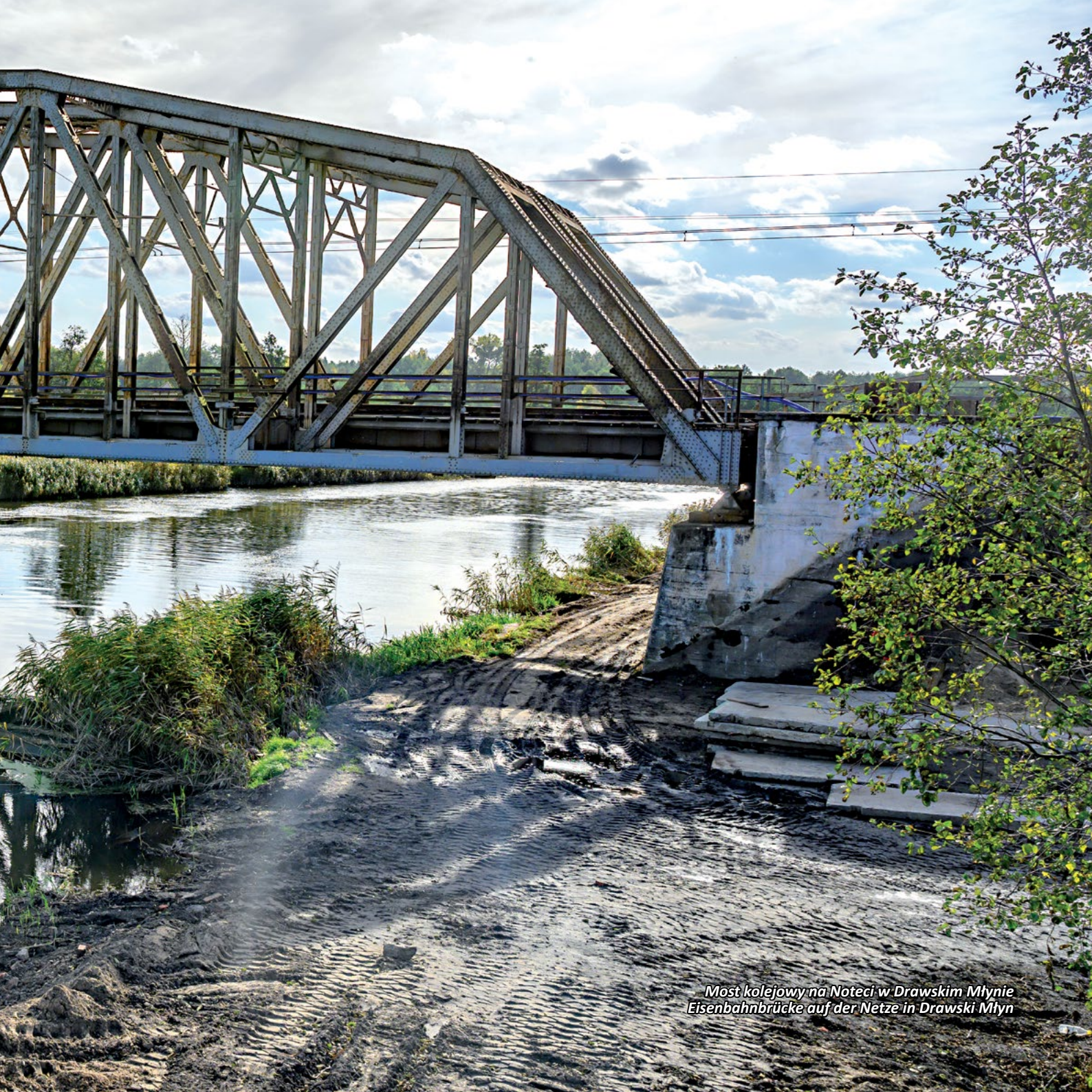
Most kolejowy na Noteci w Drawskim Młynie Eisenbahnbrücke auf der Netze in Drawski Młyn