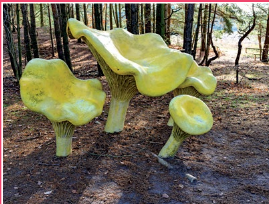
Park Grzybów Leśnych w Piłce Pilzpark in Piłka