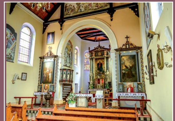
Wnętrze kościoła Das Innere der Kirche in Piłka