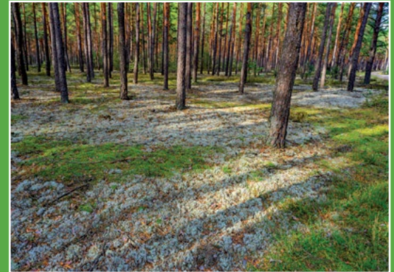
Uboższe lasy Puszczy Noteckiej Arme Wälder im Netzer Urwald

Obszar Natura 2000 „Puszcza Notecka” PLB300015. Obszar stanowi zwarty, jednolity kompleks leśny w międzyrzeczu Noteci i Warty, będącym częścią pradoliny Eberswaldsko-Toruńskiej. Jest to najwięk-