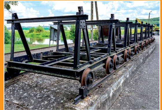
Na noteckiej śluzie An der Netzeschleuse

Ryby sprawić, oczyścić, opłukać, pokroić na dzwonka. W rondlu rozgrzać olej, wrzucić obraną, pokrojoną cebulę oraz obrany i zmiążdżony czosnek. Podsmżyć nie rumieniąc, dodać ryby i dusić 15 minut, mieszając drewnianą łyżką. Włoszczyznę obrać, umyć, rozdrobnić, zalać 2 litrami wody i ugotować wywar. Do garnka z rybami wlać wino, 2 litry wywaru z warzyw, dodać przyprawy korzenne, tymianek i gotować wszystko na małym ogniu 1 godzinę. Następnie zupę przecedzić, a ryby przetrzeć przez sito. Doprawić szafranem, solą i pieprzem. Podawać w filiżankach, z dodatkiem grzanek. Ser do posypania zupy podać w osobnym naczyniu. Jeżeli po wigilii zostanie jej trochę, można ją zaprawić śmietaną, posypać siekaną pietruszką i podać z łazankami lub drobnym makaronem.