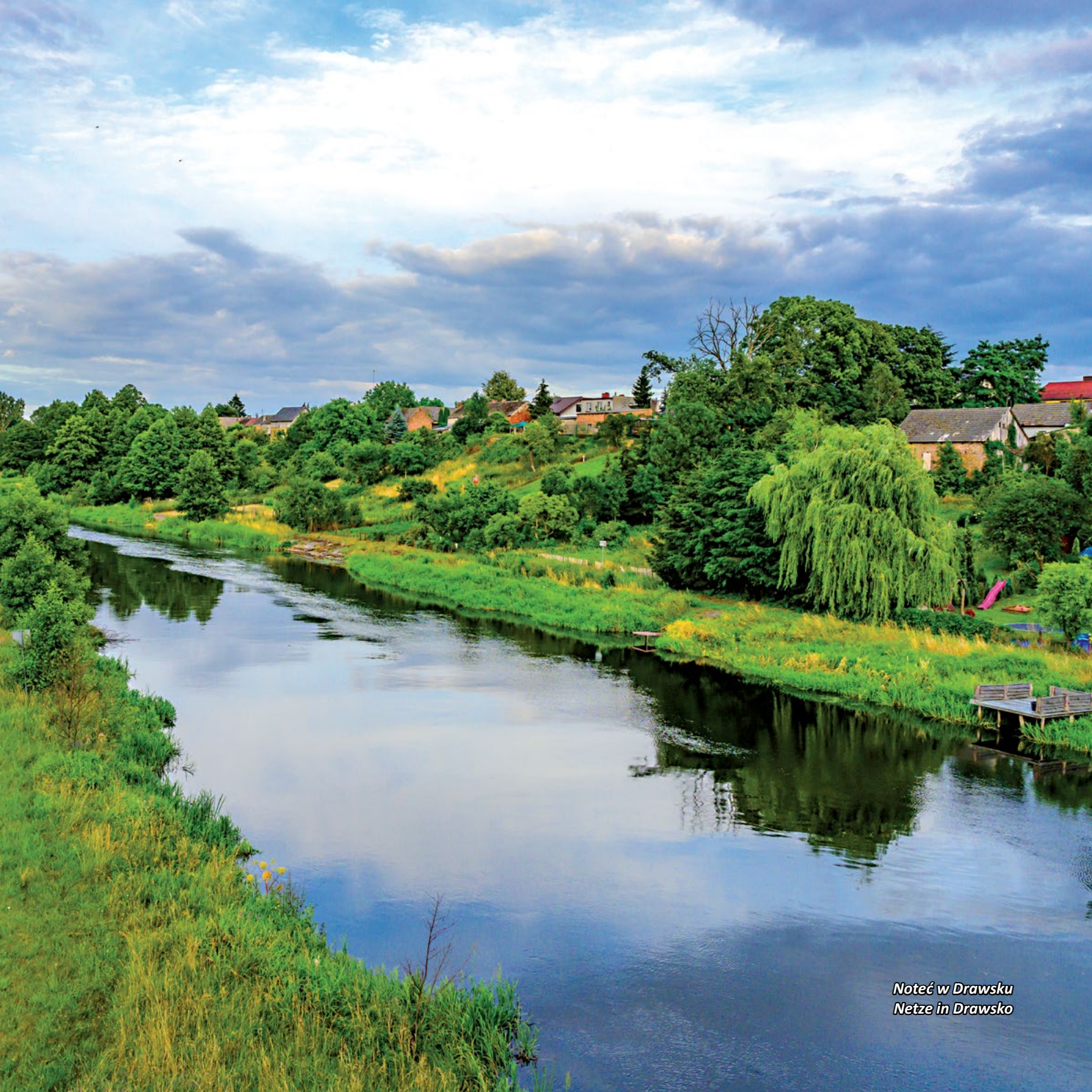
Noteć w Drawsku Netze in Drawsko