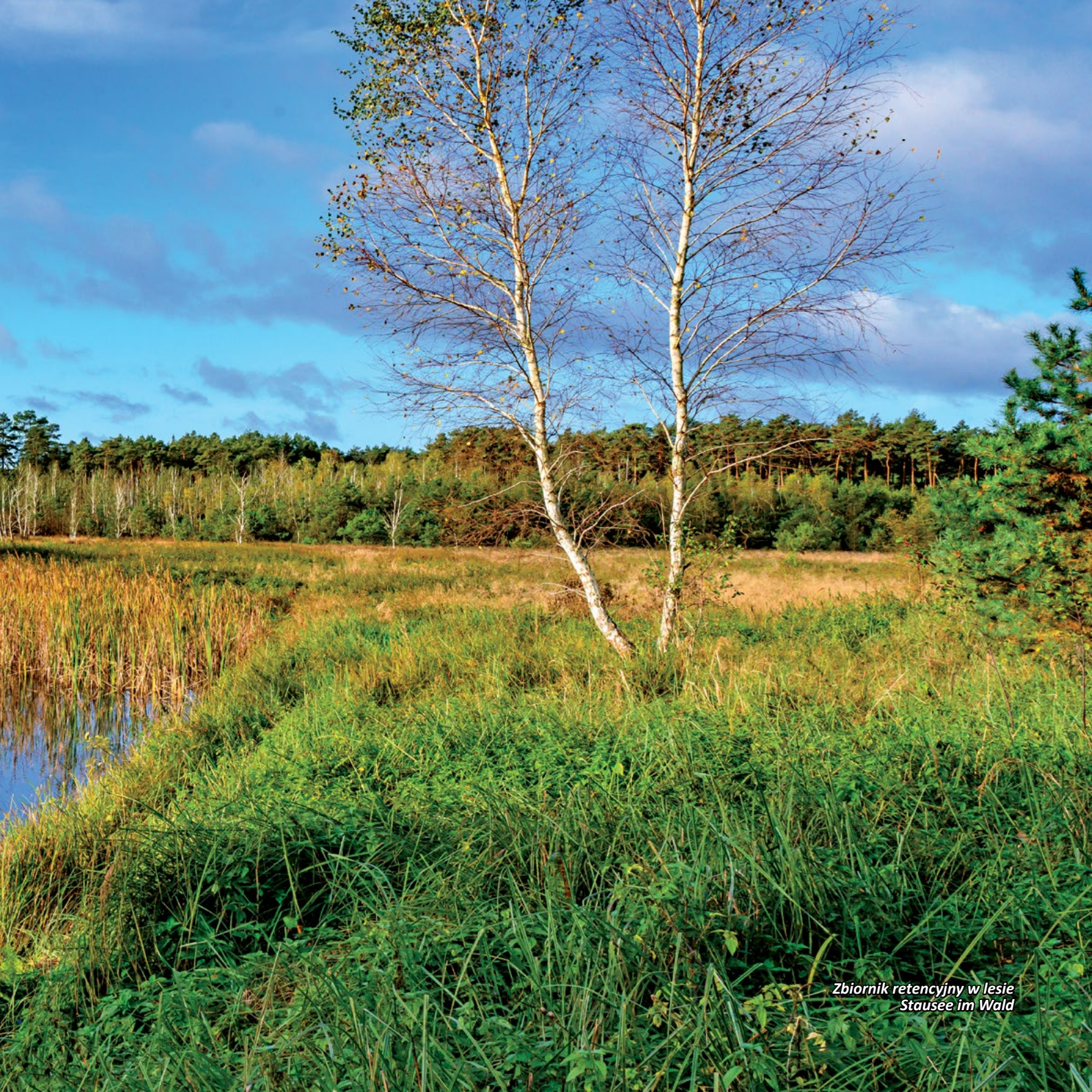
Zbiornik retencyjny w lesie Stausee im Wald