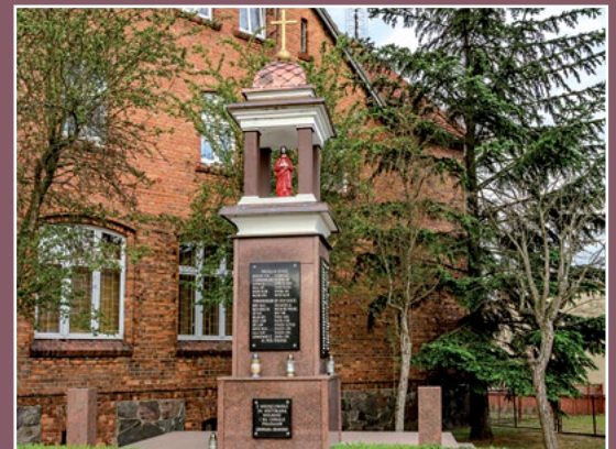
Pamięci poległych mieszkańców Drawska Denkmal der gefallenen Einwohner von Drawsko