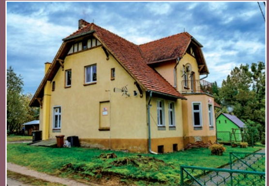
Przedszkole w Piłce Kindergarten in Piłka