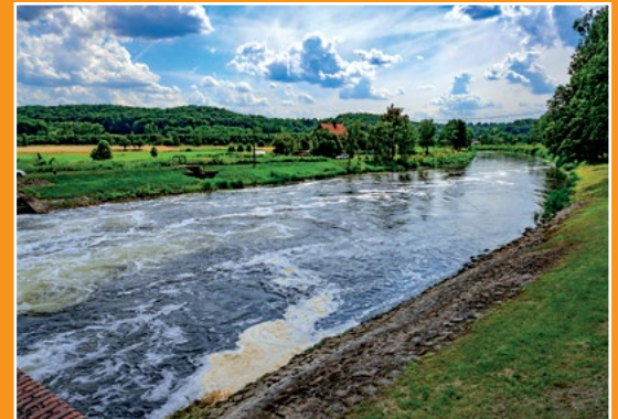
Notek w Pianówce Netze in Pianówka