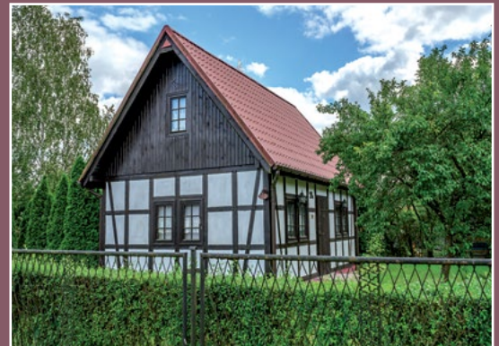
Stary dom w Kwiejcach Starych Altes Haus in Kwiejce Stare