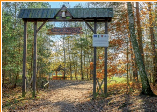
Park Grzybów Leśnych Piłzpark