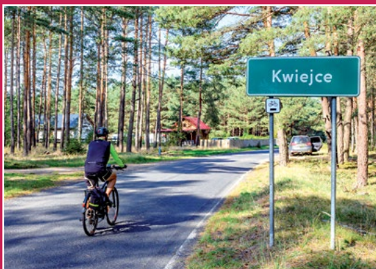
Na szlaku rowerowym przed Kwiejcami Auf dem Radweg vor Kwiejce

Kolejny szlak dalekobieżny to szlak niebieski dalekobieżny PTTK o przebiegu ogólnym Ujście – Czarnków – Sieraków – Międzychód – Pszczew – Zbąszyń – Kaszczor – Leszno – Góra – Wąsosz , długości całkowitej 365,2 km.