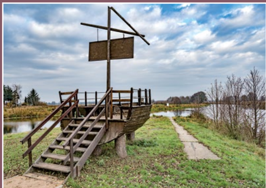
Punkt widokowy nad Notecią Aussichtspunkt an der Netze