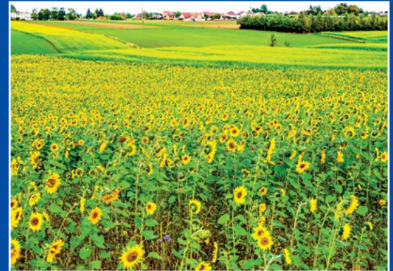
Słonecznikowe pola koło Drawsko Sonnenblumen Felder bei Drawsko