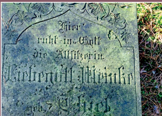
Nagrobek z cmentarza ewangelickiego w Piłce Grabstein auf dem evangelischen Friedhof in Piłka

W XIX w. wieś miała 97 domów, 745 mieszkańców (529 katolików, 216 protestantów). Pierwszy kościół – drewniany wybudowali Piotr Sapiaha i jego żona Joanna z Sułkowskich. W 1767 r. Sapiaha sprowadził również nowych osadników, co przyczyniło się do dużego rozwoju wsi. Pierwszy kościół spłonął a kolejny wybudowano w 1868 r.