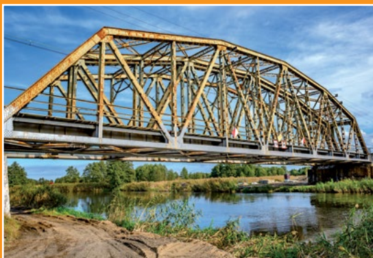
Most kolejowy na Noteci Eisenbahnbrücke auf der Netze