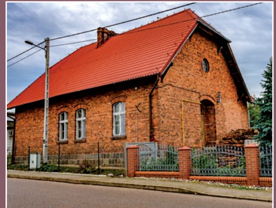
Dawna kaplica ewangelicka w Piłce Ehemalige evangelische Kapelle in Piłka