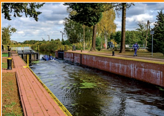
Śluza w Drawskim Młynie Schleuse in Drawski Młyn

Po pierwszej wojnie światowej kanał bydgoski znalazł się w Polsce, a reszta drogi wodnej Wisła - Odra została wzdłuż osi przecięta granicą państwową, co osłabiło jej znaczenie. Pomimo to uznano ją za najsprawniejszą i najpiękniejszą sztuczną drogę Rzeczypospolitej. Drogę tę obsługiwały dwie załogi - po południowej stronie polską, po północnej niemiecką.