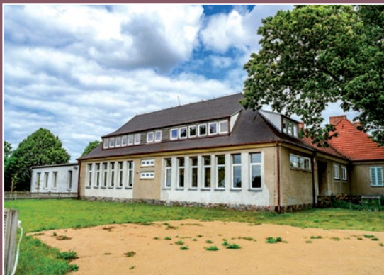
Szkoła w Chełście Schule in Chełst

gatunków: dębów, lip, świerków, jesionów, modrzewia. Na terenie parku znajdują się dworek – dawna nadleśniczówka i budynki gospodarcze. Według innych źródeł dworek pochodzi z 1892 r., pralnia, obecnie budynek mieszkalny, kuchnia folwarczna obecnie budynek mieszkalny, dom robotników folwarcznych - Drawsko Nadleśnictwo 2, obora obecnie budynek gospodarczo – garażowy, budynek gospodarczo – inwentarski mur./drewno, dom służby obecnie budynek gospodarczy