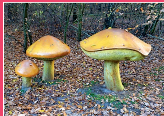
Park Grzybów Leśnych w Piłce Pilzpark in Piłka