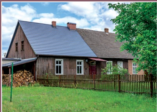
Stary dom w Kwiejcach Starych Altes Haus in Kwiejce Stare