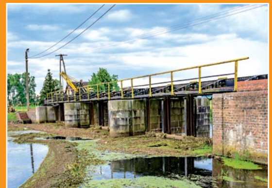
Stopień piętrzący Rosko Stauwehr in Rosko