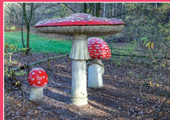
Park Grzybów Leśnych w Piłce Pilzpark in Piłka