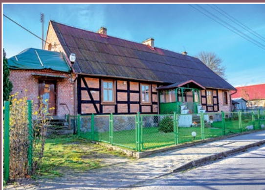
Stary dom w Chełście Altes Haus in Chełst